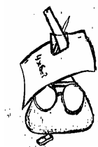
Club de Ciencias "Los Indecisos"