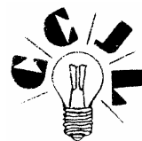
Congreso Científico Juvenil de Lincoln